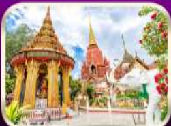
ซอพรหลวงปู่ทวด วัดช้างให้