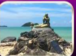
เที่ยวหาดสมิหลา สงขลา