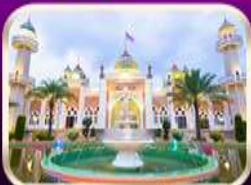
ชมมัสยิดกลางปัตตานี