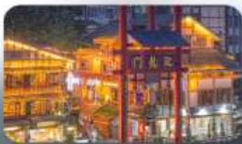
หมู่บ้านโบราณสื่อปาที