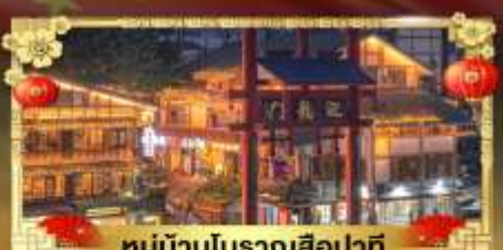
หมู่บ้านโบราณสี่ปาตี

เที่ยว 2 มณฑล "ฉงชิ่ง & เฉิงตู" อุทยานหลุมบ่อฟ้า ภูเขาสี่ดรุณี