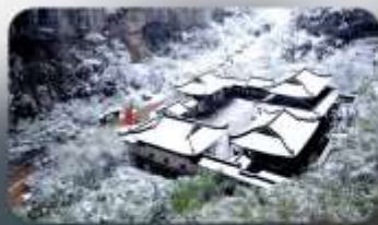
อุทยานหลุมฟ้า