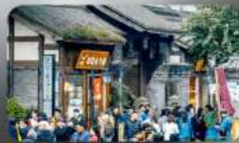
ถนนชอยกว้างชอยแคบ