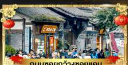
ถนนชอยกว้างชอยแคบ