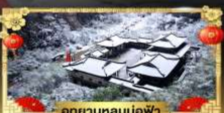
อุทยานหลุมบ่อฟ้า