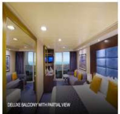
DELUXE BALCONY WITH PARTIAL VIEW