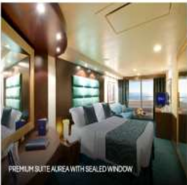
PREMIUM SUITE AUREA WITH SEALED WINDOW