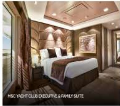
MSC YACHT CLUB EXECUTIVE & FAMILY SUITE