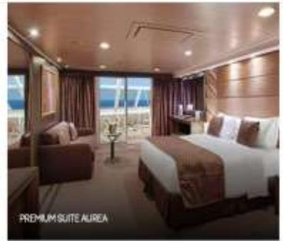
PREMIUM SUITE AUREA