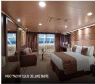
MSC YACHT CLUB DELUXE SUITE