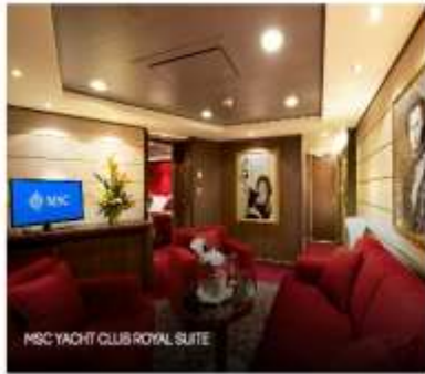
MSC YACHT CLUB ROYAL SUITE