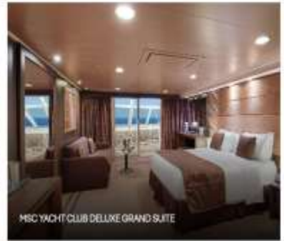
MSC YACHT CLUB DELUXE GRAND SUITE