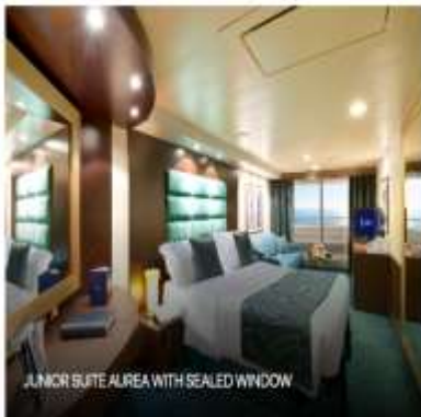
JUNIOR SUITE AUREA WITH SEALED WINDOW