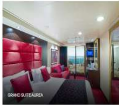
GRAND SUITE AUREA