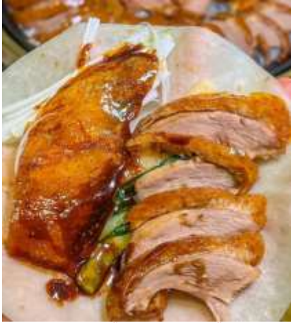
*ภาพนี้ใช้เพื่อการโฆษณาเท่านั้น*