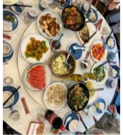
*ภาพนี้ใช้เพื่อการโฆษณาเท่านั้น*