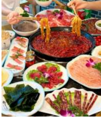
*ภาพนี้ใช้เพื่อการโฆษณาเท่านั้น*