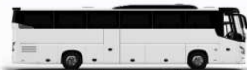
ตัวอย่างรูปภาพรถ 1 ชั้น