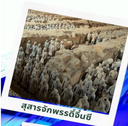
สุสานจักรพรรดิจีนซี