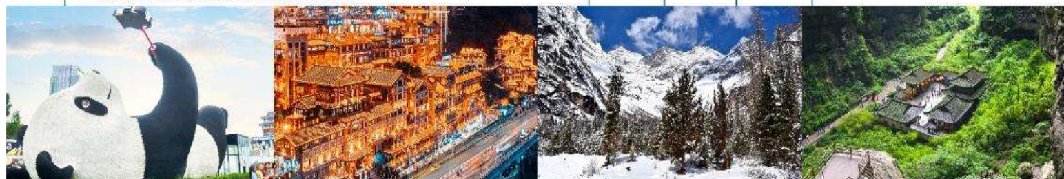
แพนด้าเซลฟี่