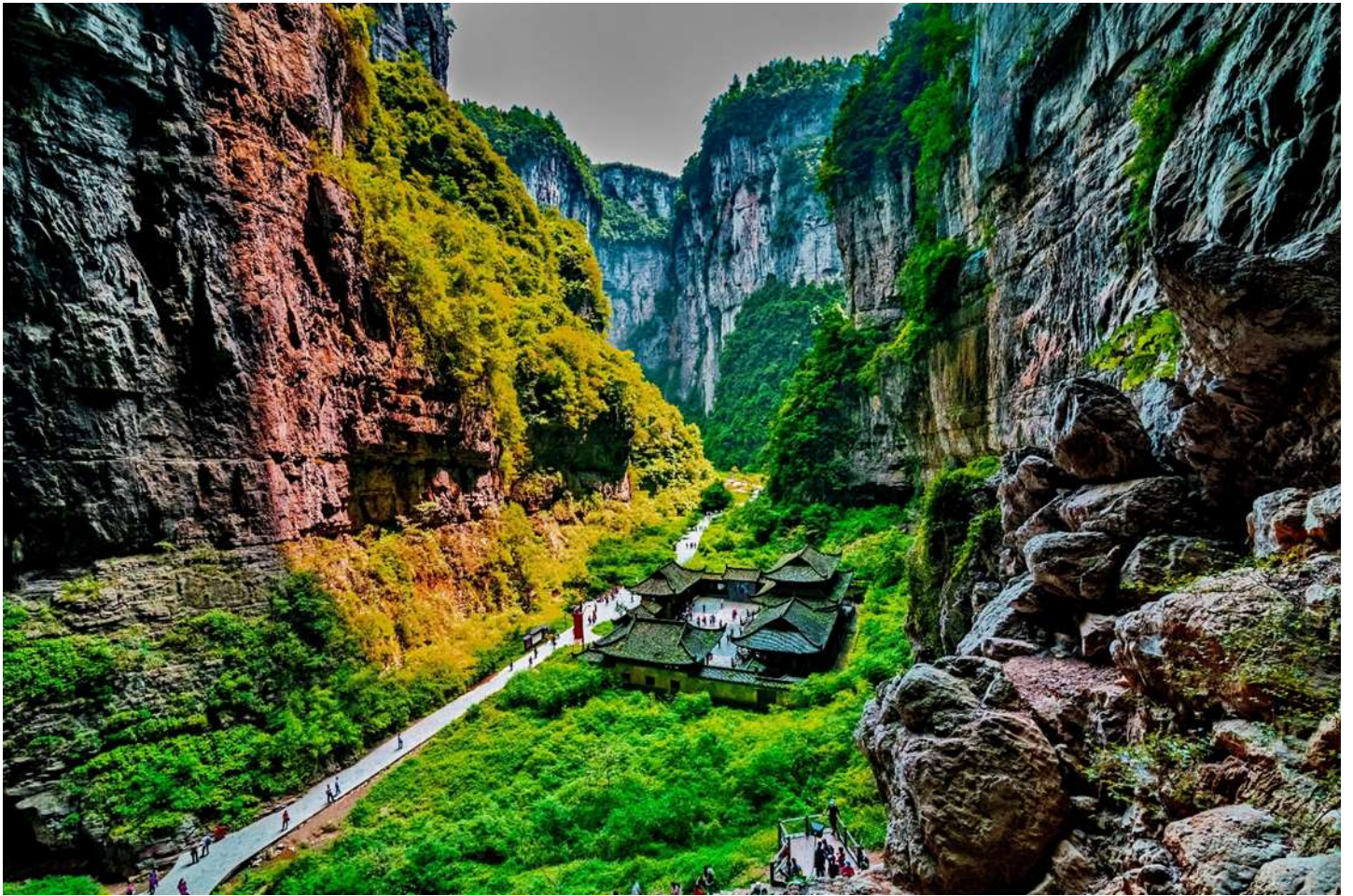
ภูเขา (รวมลิฟท์แก้วลง+รถอุทยาน+รถอล์ฟ)

นำท่านเดินทางสู่ อุทยานแห่งชาติหลุมฟ้า 3 สะพานสวรรค์ (Three Natural Bridges) หรือ “เทียนเซิงซ่านเฉียว” ซึ่งถือว่าเป็นมรดกโลกทางธรรมชาติระดับ 5A ที่มีความสวยงามมากที่สุดในเมืองอู่หลง ตั้งอยู่ห่างจากเมืองอู่หลงประมาณ 18 กิโลเมตร เกิดจากการยุบตัวของเปลือกโลก ทำให้เกิดเป็นบ่อหลุมขนาดใหญ่ที่ลึกประมาณ 300-500 เมตร และมีบางส่วนเป็นโพรงทะลุเหมือนกับสะพานทอดข้ามระหว่าง