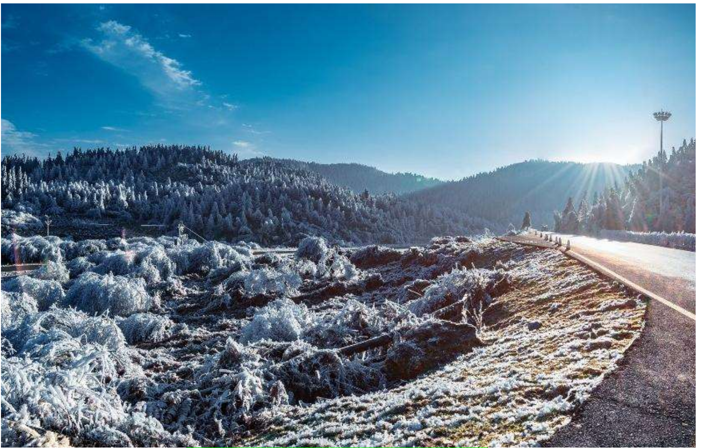
อุทยานเขานางฟ้า (Fairy Maiden Mountain)