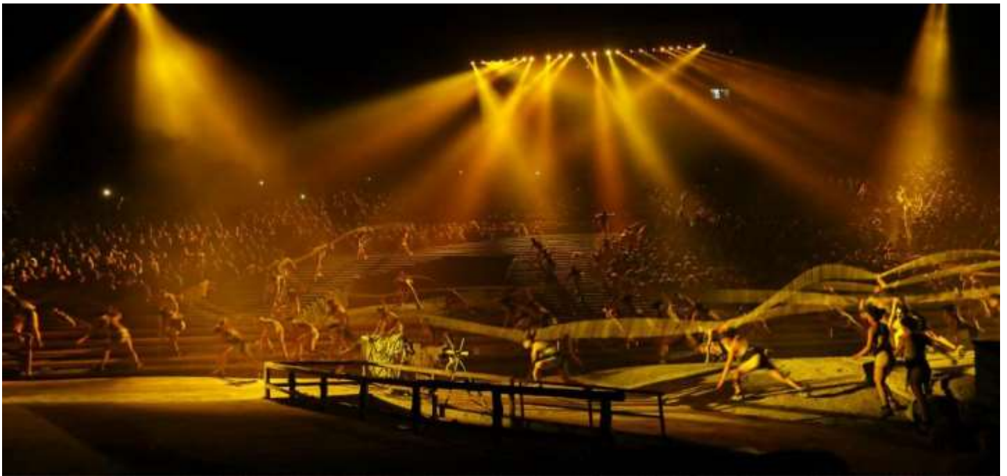
โชว์ Impression Wulong