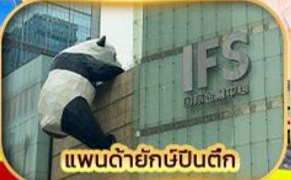
แพนด้ายักษ์ปิ่นตึก