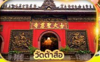
วัดต้าสือ