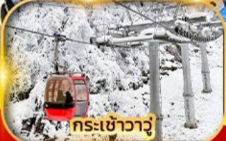
กระเช้าวาจู่