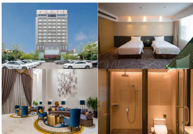
โรงแรม HAIYU HOTEL ระดับ 4 ดาว หรือเทียบเท่า