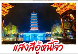
แสงสีอุ้หนี่โจว