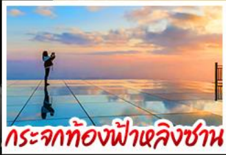
กระจกท้องฟ้าเหลิ่งซาน