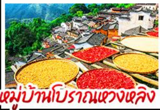
หมู่บ้านโบราณแขวงเหลิ่ง

- หุบเขาเทวดา "วังเซียนกู่" - หมู่บ้านโบราณหวงหลิง - กระจกท้องฟ้าหลิงซาน - แสงสีอุ้หนี่โจว