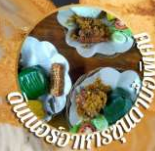
อาหารจานหลักแสนอร่อย

หนึ่งในแดน ที่มีชื่อเสียงที่สุด ในซอร์บากาตา