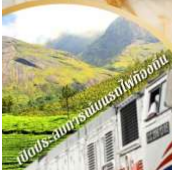
เปิดประสบการณ์รถไฟท่องเที่ยว