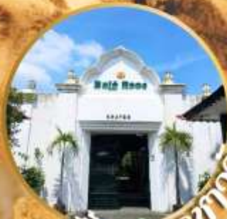
เมืองอาหารสวย