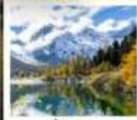
ปี้ผิงโกว