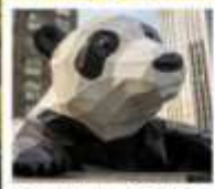
ห้าง IFS แพนด้าปิ่นตึก