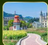
สวน Alice's Garden