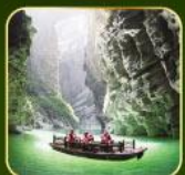
ล่องเรือแม่น้ำใต้ดินกุ้อว