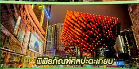
พิพิธภัณฑ์ศิลปะตะเกียบ