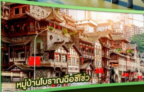
หมู่บ้านโบราณฉือชิว