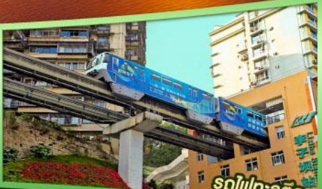
รถไฟทะลุคัง