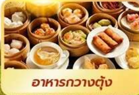
อาหารกวางตุ้ง