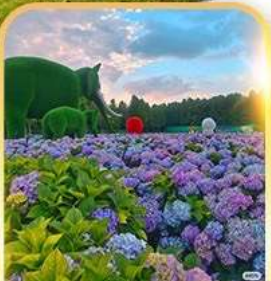
ดอกไม้ตามฤดูกาล