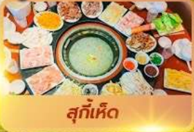
สุกี้เห็ด