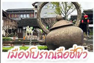
เมืองโบราณฉือชิว