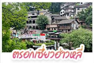
ตรอกเซียวฮ่าวเฉี