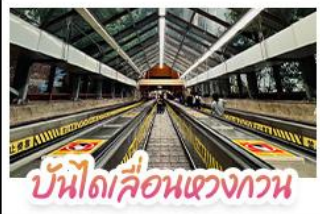
บันไดเลื่อนแขวงกาน