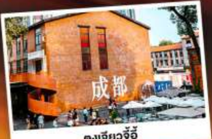
ตงเจียวจี้

เทศกาลแอปเปิ้ลแห่งเมืองจีน ชมความงามของ "อุทยานภูเขาเสีครณี"