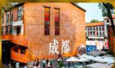
ตงเจียวจี้