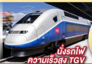
นั่งรถไฟ ความเร็วสูง TGV