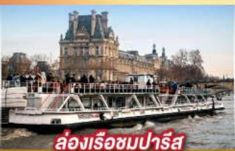
ล่องเรือชมปารีส