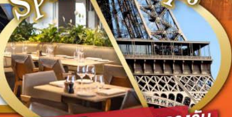
รับประทานอาหารกลางวัน บนหอไอเฟล

ไฮไลท์ในโปรแกรม • สะพานไม้ชาเปล ลูเซิร์น