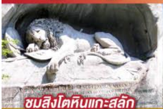
ชมสิงโตหินแกะสลัก