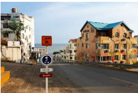
ถนนคอบเพลิงหมายเลข 8

นำท่านชมสวนสาธารณะเว่ยไห่ 威海公园 สวนสาธารณะริมทะเลที่ใหญ่ที่สุดของเมืองเว่ยไห่ ให้ท่านชมและถ่ายภาพคู่กับ กรอบรูปยักษ์วิวทะเล 威海公园大相框 แลนด์มาร์คที่เป็นอีกหนึ่งไฮไลท์ที่สุดฮิตของเว่ยไห่