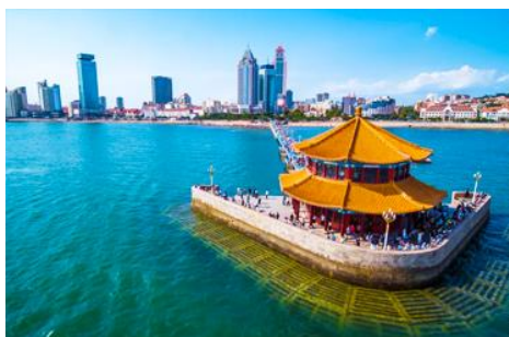
สะพานเทียนเจียว