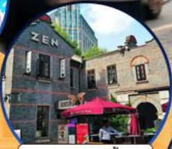
ซินเทียนตี้