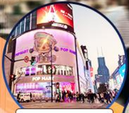
ถนนหนานจิง