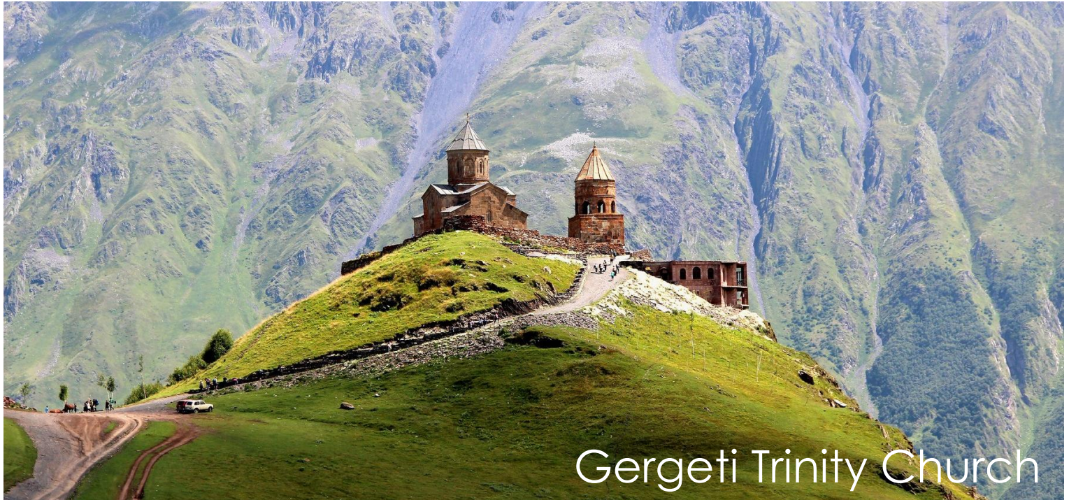
Gergeti Trinity Church

ตั้งอยู่บนเทือกเขาคอเคซัสเบกที่ระดับความสูงจากน้ำทะเล 2,170 เมตร (ในกรณีที่มีหิมะตกหนัก จนไม่สามารถเดินทางได้ ทางบริษัทขอสงวนสิทธิ์ ปรับเปลี่ยนโปรแกรมตามความเหมาะสม)