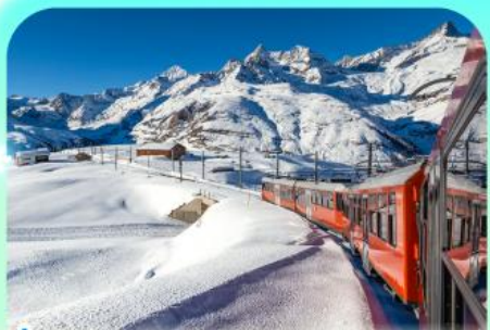
นั่งรถไฟสู่ยอดเขารอนเนอร์เกรด