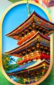
วัดนาริตะ-ซัง