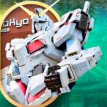
ห้างโอโดะปะกินคัม