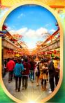
ถนนนากามิสะ