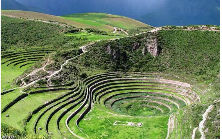
บาย นำท่านเดินทางสู่ มาราซ (Maras) แหล่งผลิตเกลือที่คุณภาพดีที่สุดในโลก ที่มีมาตั้งแต่สมัยอินคา แนว นาขั้นบันไดที่เรียงอยู่ตามลำดับความสูงของภูเขา จากนั้นเดินทางสู่ โมเรย์ (Moray) นาขั้นบันไดวงกลมขนาดใหญ่หลายารูปทรงแปลกตาที่ชาวอินคาทำ ไว้เพื่อทดลองปลูกพืชพันธุ์ต่างๆ จากจุดนี้สามารถมองเห็น หมู่บ้านอูรัมบัмба (Urubamba) ได้อีกด้วย ได้เวลาเดินทางกลับสู่เมือง เมืองคัสโก (Cusco) เมืองหลวงของอาณาจักรอินคา ที่แพร่ขยายอำนาจจน กินพื้นที่ 1 ใน 3 ของอเมริกาใต้ ตั้งอยู่เหนือระดับน้ำทะเลถึง 3,400 เมตร และเป็นแหล่งอารยธรรมยุค ก่อนประวัติศาสตร์ที่ลึกลับน่าทึ่ง เป็นชุมชนเก่าแก่ของจักรวรรดิอินคาอันรุ่งเรือง ซึ่งยังคงทิ้งร่องรอยความ เจริญไว้ให้เห็นเป็นซากปรักหักพังโบราณและโบราณวัตถุต่างๆ