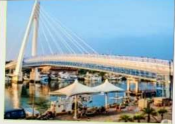
สะพานคู่รักตั้นส่วย