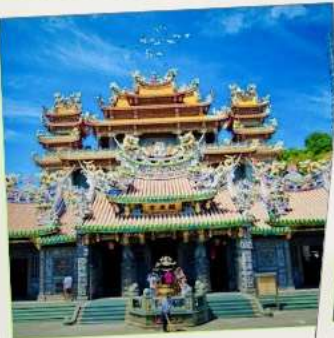
วัดกวนตู่