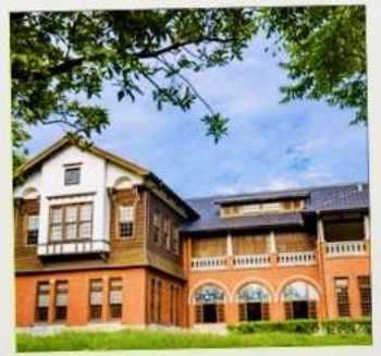
พิพิธภัณฑน์น้ำพุร้อนเป่ยโถว