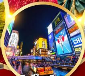
ช้อปปิ้งชินโซบาช