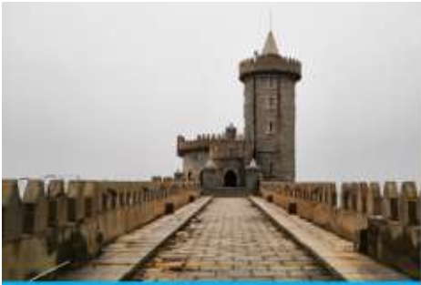
คาเฟ่อัสดง