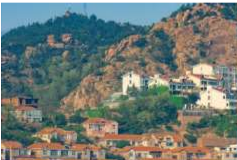
หมู่บ้านซาจื่อโข่ว

จากนั้นนำท่าน เดินทางสู่ คาเฟ่อัสดง 落日古堡 นำท่านชมปราสาทในเทพนิยาย ที่ตั้งตระหง่านอยู่ริมชายหาด นานาชาติเวทย์ให้ คาเฟ่ที่ออกแบบด้วยสถาปัตยกรรมสไตล์ยุโรป ตัดกับวิวทะเลสีคราม และที่นี่คือแม่เหล็กดึงดูดนักท่องเที่ยวมาเก็บบรรยากาศความสวยงามความโรแมนติก ( ตัวปราสาทเป็นร้านกาแฟ หากท่านต้องการเข้าไปด้านใน ต้องจ่ายค่าเครื่องดื่ม ตามเมนูของทางร้าน ซึ่งไม่รวมในอัตราค่าทัวร์ )