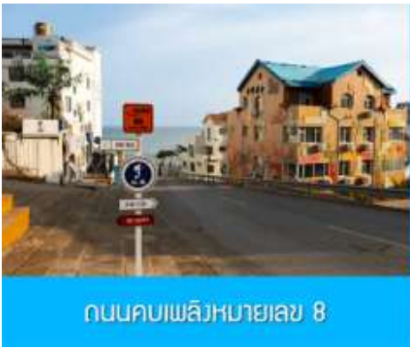
ถนนคอบเพลิงหมายเลข 8

นำท่านชมสวนสาธารณะเว่ยไห่ 威海公园 สวนสาธารณะริมทะเลที่ใหญ่ที่สุดของเมืองเว่ยไห่ ให้ท่านชมและถ่ายภาพคู่กับ กรอบรูปยักษ์วิวทะเล 威海公园大相框 แลนด์มาร์คที่เป็นอีกหนึ่งไฮไลท์ที่ฮิตของเมืองเว่ยไห่