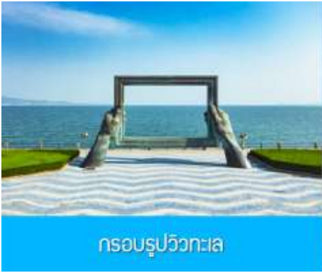
กรอบรูปวิวทะเล