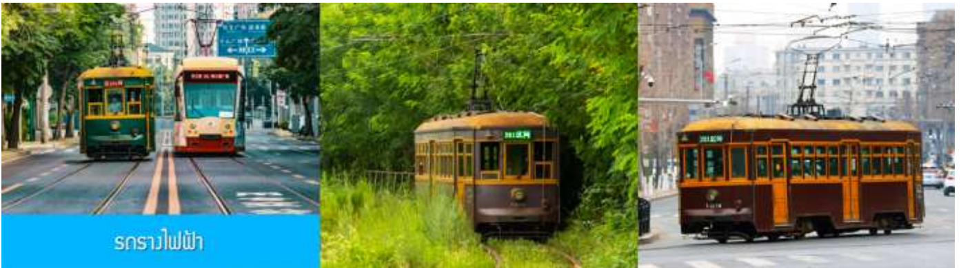
รถรางไฟฟ้า