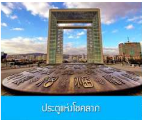
ประตูแห่งโชคกลาง