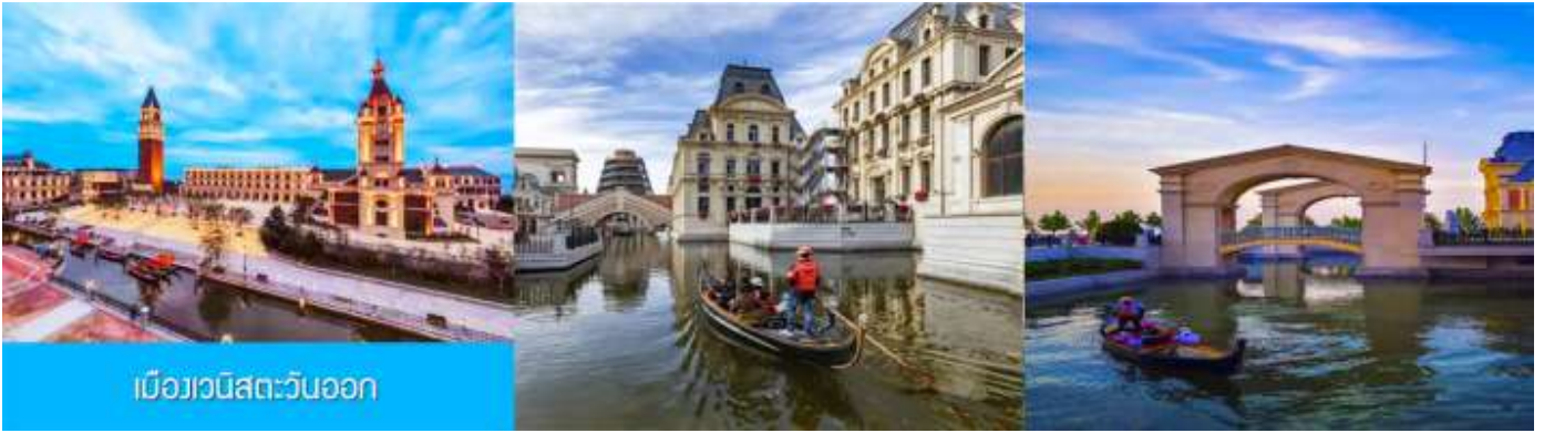
เมืองเวนิสตะวันออก