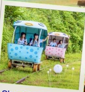
Shen'ao Rail Bike