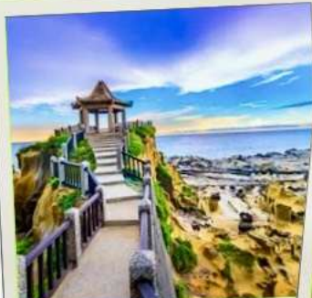
อุทยานเกาะเหอผิง