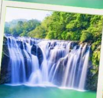
น้ำตกซือเฟิ่น