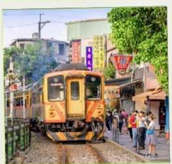
สถานีรถไฟซือเฟิ่น