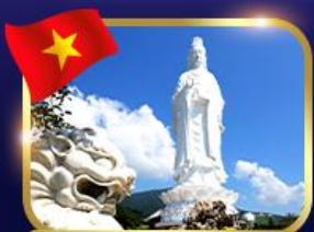
ชมพระอภิมหาอิม วัดหลินอึ้ง