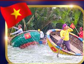
ล่องเรือกระดิว หมู่บ้านกัทนาน