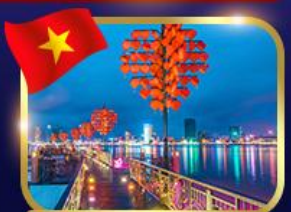
สะพานแห่งความรัก ดานัง