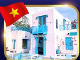
คาเฟ่สไตล์ซานโตรินี่ ชันตรา มาริน่า