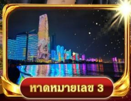
หาดหมายเลข 3