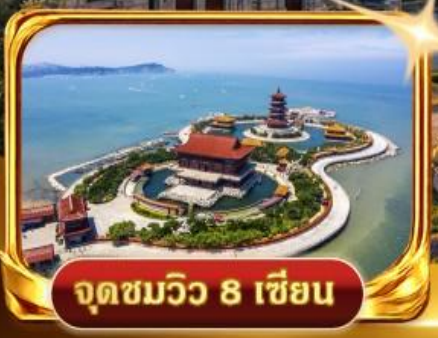
จุดชมวิวกว 8 เชียง