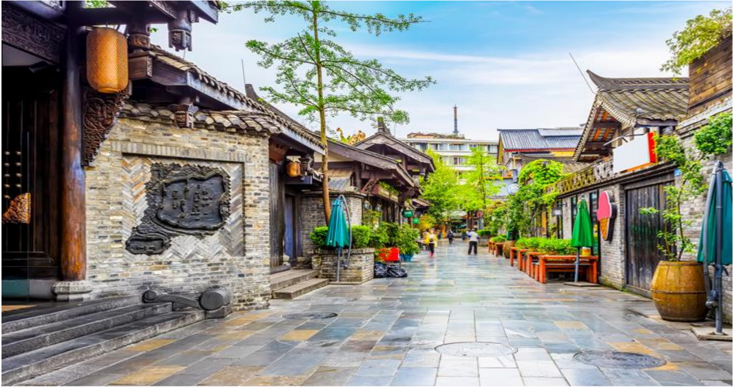
กลางวัน รับประทานอาหารกลางวัน ณ ภัตตาคาร (เมื่อที่ 11)