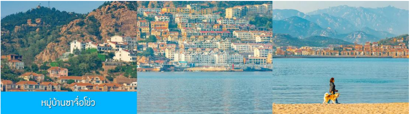
หมู่บ้านซาจื่อโข่ว

เช้า รับประทานอาหารเช้า ณ ห้องอาหารของโรงแรม (4)