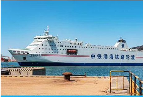
เรือ ZHONGTIE BOHAI CRUISE

เมื่อเวลาแก่เวลา นำท่านขึ้นเรือ ZHONGTIE BOHAI CRUISE เพื่อเดินทางสู่เมืองต้าเหลียน