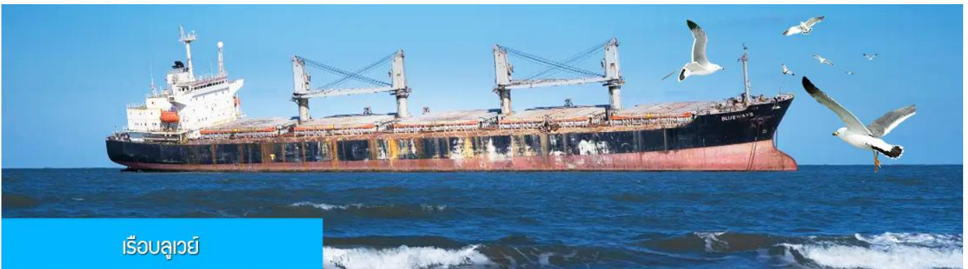
เรือบลูเวย์

เที่ยง รับประทานอาหารกลางวัน ณ ภัตตาคาร (5)