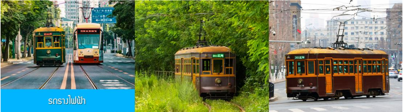
รถรางไฟฟ้า