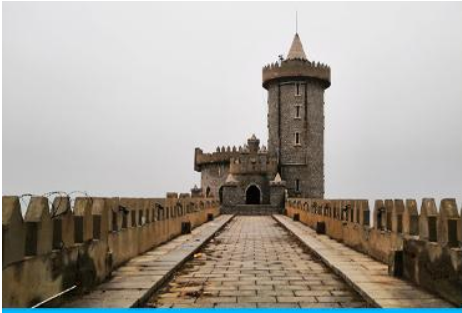
คาเฟ่อีสดง