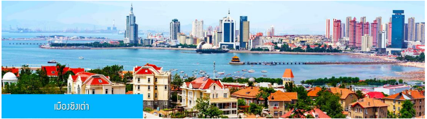
เมืองชิงเต่า