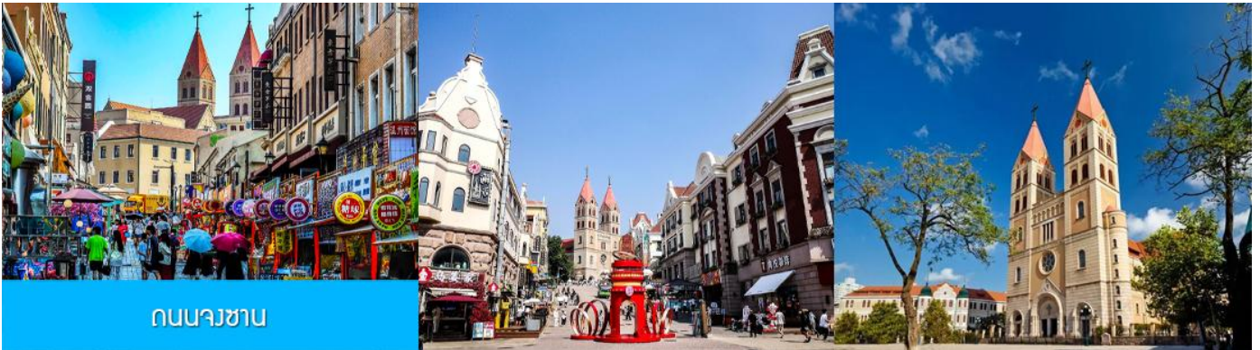
ถนนางซาน