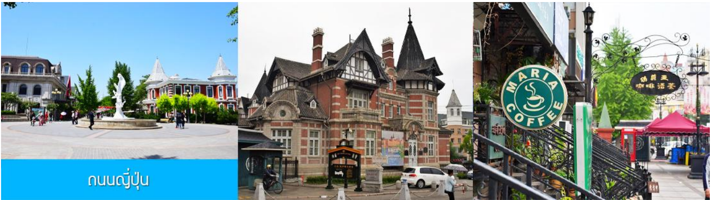
ถนนญี่ปุ่น