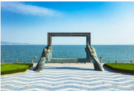
กรอบรูปวิวทะเล

เช้า รับประทานอาหารเช้า ณ ห้องอาหารของโรงแรม (7)