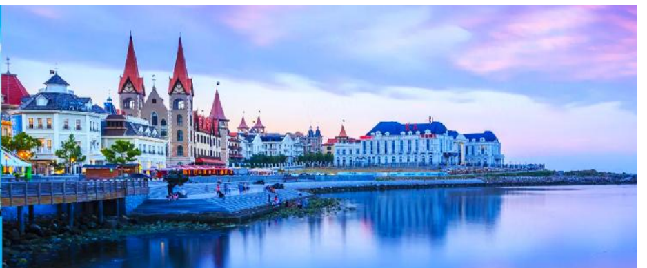
ท่าเรือชาวประมงไห่ซาง