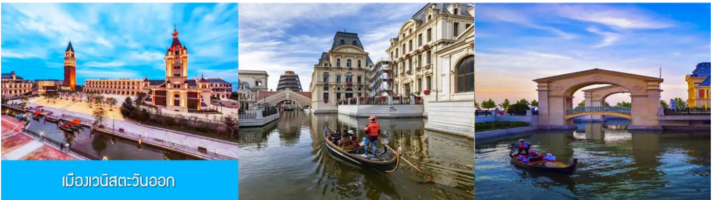
เมืองเวนิสตะวันออก

จากนั้นนำท่านเที่ยวชม เมืองเวนิสตะวันออก 大连东方威尼斯城 เป็นเมืองเวนิสจำลองที่ถูกสร้างขึ้นด้วยทุนกว่า 8,000 ล้านบาท ออกแบบโดยบริษัท ARC จากประเทศฝรั่งเศส โดยจำลองผังเมืองเวนิสในประเทศอิตาลี