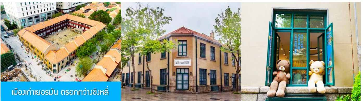
เมืองเก่าเยอรมัน ตรอกกว้างชิงหลี