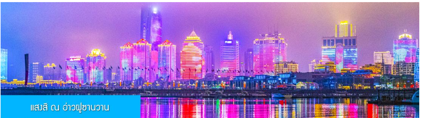
แอสสิ ณ อ่าวฟูซานวาน

ถ้า รับประทานอาหารค่ำ ณ ภัตตาคาร *เมนูซีฟู้ด (3)