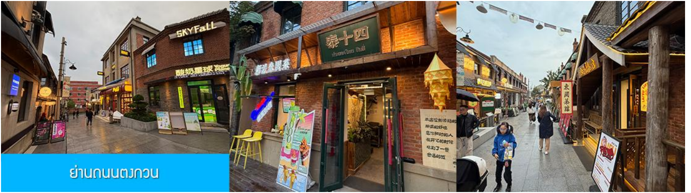
ย่านถนนตวงกวน