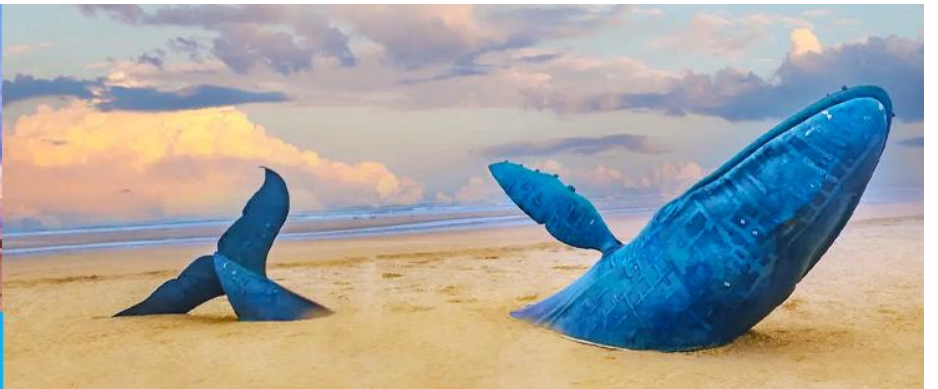
ประติมากรรม วาฬโดดเดี่ยว

นำท่านถ่ายภาพสุดสร้างสรรค์ที่ประติมากรรม วาฬเกยตื้น หรือวาฬโดดเดี่ยว 孤独的鲸 วาฬยักษ์ตัวนี้กำลังกระโดดขึ้นจากทะเล ซ่อนตัวอยู่ท่ามกลางทะเลป้อให้สับสนปากราม เป็นจุดถ่ายภาพยอดนิยมในช่วงน้ำลง ให้ท่านได้เก็บภาพ จุดไฮไลต์ที่เป็นที่ระลึก