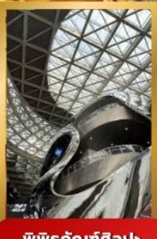
พิพิธภัณฑ์ศิลปะร่วมสมัยเซินเจิ้น

ชมสถาปัตยกรรมระดับโลก พิพิธภัณฑ์ศิลปะร่วมสมัยเซินเจิ้น (MOCAPE) และ Shenzhen Civic Center