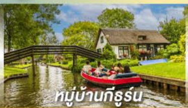
หมู่บ้านทีรูร์น