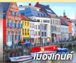
เมืองกันต์