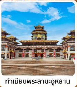
ทำเนียบพระลามะอุหลาน

ไฮไลท์ทะเลทรายอินเคินทาลา เขตท่องเที่ยวเจงกิสข่าน ทำเนียบพระลามะอุหลาน ตลาดตอนกลางคืนเมืองตาลาเต๋อ