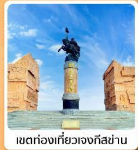
เขตท่องเที่ยวเจงกิสข่าน