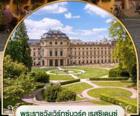
พระราชวังแวร์ซายส์ ฝรั่งเศส