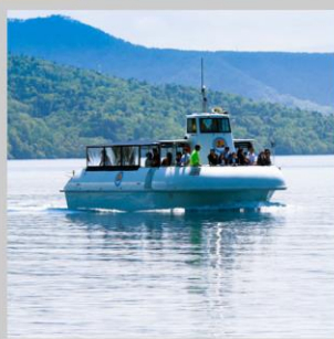
“LAKE SHIKOTSU GLASS BOAT”