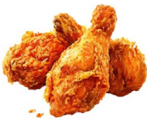
● เนื้อสัตว์ปีก (ไก่)