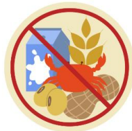
● แพ้อาหาร / อื่นๆโปรดระบุ