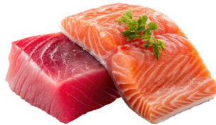
● เนื้อปลาดิบ