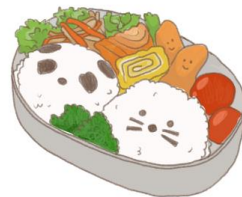
● อาหารสำหรับเด็ก ( 2-11 ปี ) *วัตถุประสงค์ขึ้นอยู่กับทาว์ราน