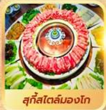
สุกีสโตลัมมองโก