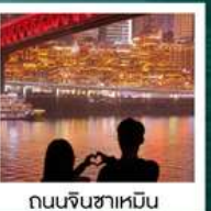
ถนนจินซาเหมิน