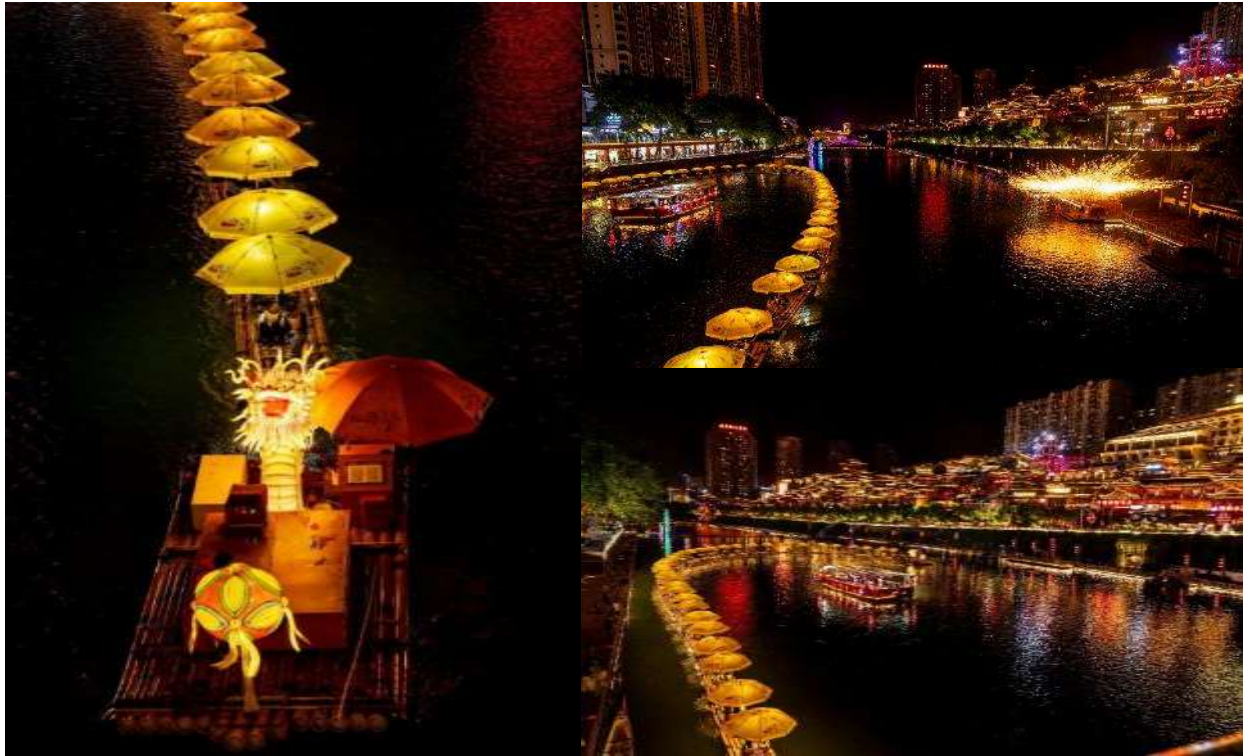
👉 พักที่ XUANEN METROPOLO HOTEL หรือเทียบเท่าระดับ 5 🌟🌟🌟🌟🌟