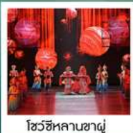
โชว์ซีหลานซาตู้