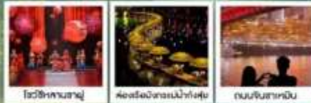
โซ่วซีหลานซาญู