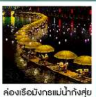
คลองเรือมังกรแม่น้ำก้งซุย