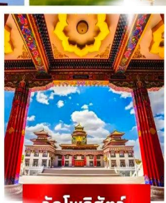
วัดไพรีสัตว์