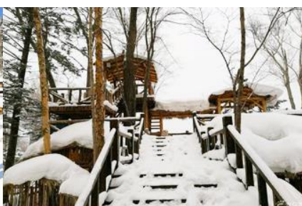
ระเบียบชมวิวย้ำจู่ชาน

วันที่สาม เมืองฮาร์บิน-สถานีรถไฟยาบูลิ-รวมนั่งม้าลากเลื่อน- หมู่บ้านหิมะ Xue xiang China Snow Town - ระเบียบชมวิวย้ำจู่ชาน- ชมแสงสียามราตรีหมู่บ้านหิมะ-ชมพลุไฟและขบวนพาเหรดระบำพื้นเมือง-นอนในหมู่บ้านหิมะ Xue xiang