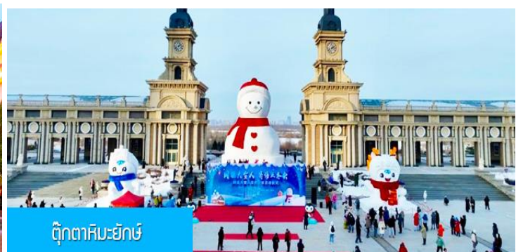
ตุ๊กตาคิมะยุกะ