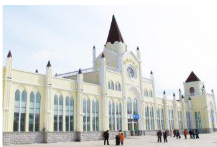
สถานีรถไฟยาบูลิ

หมายเหตุ เพื่อความสะดวกในการเข้าพักใน HOME STAY ภายในหมู่บ้านหิมะ ทางทัวร์แนะนำให้ท่านจัดเตรียมเสื้อผ้าและเครื่องใช้เท่าที่จำเป็น 1 ชุดใส่กระเป๋าใบเล็กหรือเป้แบบสะพายได้ เพื่อสะดวกในการนำติดตัวไปใช้สำหรับคืนที่นอนในหมู่บ้านหิมะ หากนำกระเป๋าเดินทางใบใหญ่เข้าสู่ที่พักในหมู่บ้านอาจสร้างความไม่สะดวกแก่ท่าน จึงไม่แนะนำ