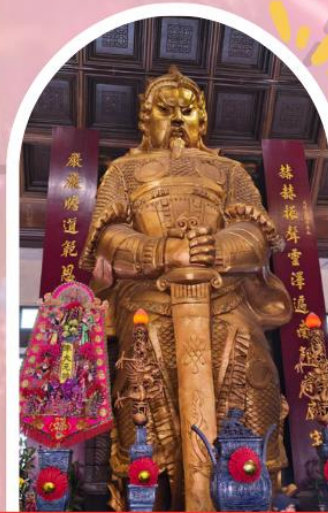
วัดเซกวง ขอพรโชคลาภ การเงิน และธุรกิจ