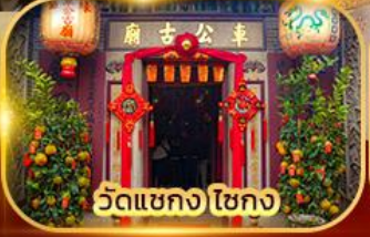
วัดเขกง ไชกง