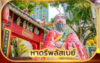
หาดรพลัสเบย์