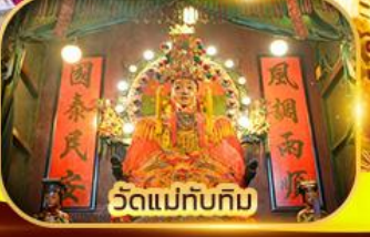
วัดแม่ทับทิม