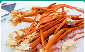
พิเศษ! บุฟเฟ่ต์ขาปู