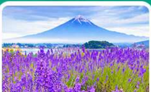
สวนโออิชิปาร์ค