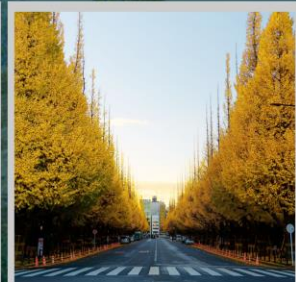
“ICHONAMIKI GINGO AVENUE”