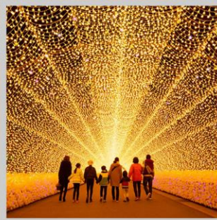
“NABANA NO SATO”