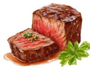
● ไส้ทานเนื้อวัว

ขอความกรุณาแจ้งวัตถุประสงค์ที่ท่าน แพ้หรือไม่สามารถรับประทานได้