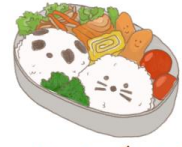
● อาหารสำหรับเด็ก ( 2-11 ปี ) *วัตถุประสงค์ขึ้นอยู่กับทาว์ราน