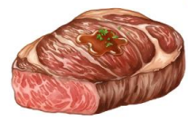
● ไส้ทานเนื้อหมู