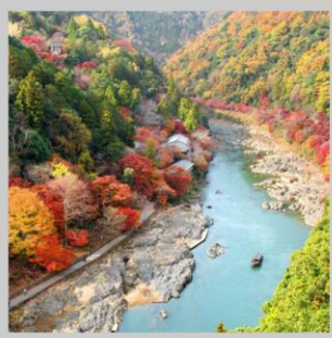
“ARASHIYAMA MT. KAMEYAMA”