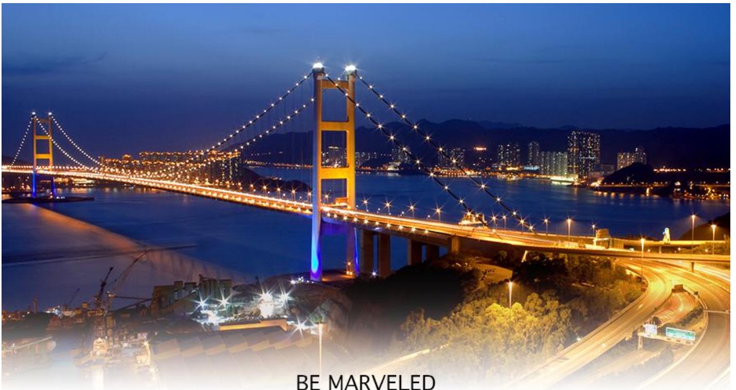
BE MARVELED สะพานแขวนชิงหม่า

17.40 น. เดินทางถึง สนามบินเซ็กแล็บก๊อก (CHEK LAP KOK INTERNATIONAL AIRPORT) เขตปกครองพิเศษฮ่องกง หลังผ่านพิธีการตรวจคนเข้าเมืองเป็นที่เรียบร้อยแล้ว รับกระเป๋าสัมภาระ เดินทางโดยรถโค้ชปรับอากาศ (เวลาที่ท้องถิ่นที่ฮ่องกง เร็วกว่าประเทศไทย 1 ชั่วโมง)