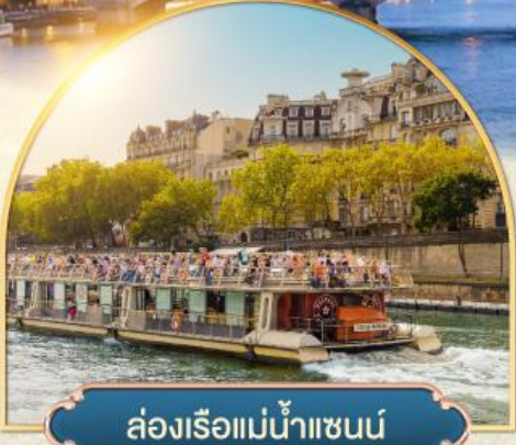
ล่องเรือแม่น้ำแซนน์