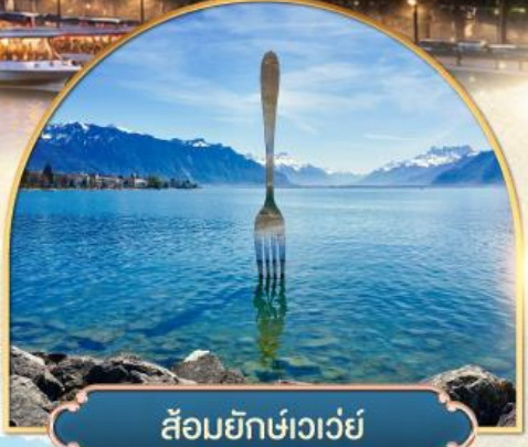
ล้อมยึกเข่าเว่ย