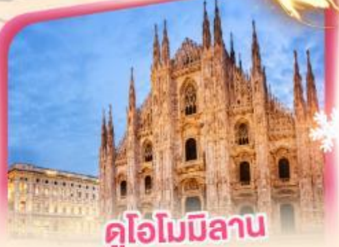
คูโอโมมิลาโน