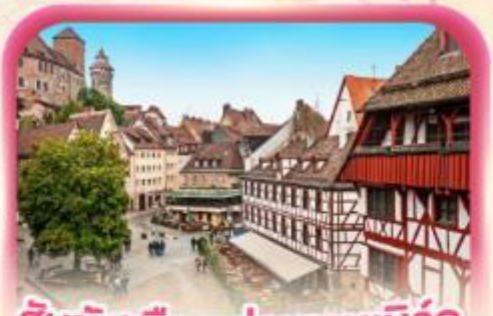
สัมผัสเมืองเก่าบูเรมเบิร์ก