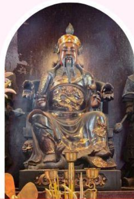
วัดปักโต เสริมโชคลาก นำพาความรุ่งเรือง