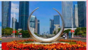
จัตุรัสฮั่วเจิง

*ทางบริษัทฯ ขอสงวนสิทธิ์ในการสลับโปรแกรมทัวร์ตามความเหมาะสมขึ้นอยู่กับสถานการณ์สำนักงาน โดยคำนึงถึงผลประโยชน์ของลูกค้าเป็นสำคัญ